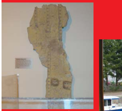
חלק מהמטוס שהתרסק בבניין התאומים ב-11/9