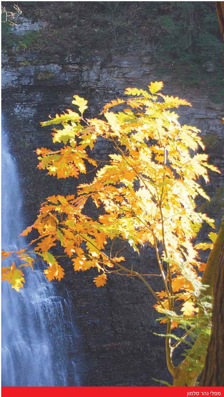
מפלי נהר סלמון