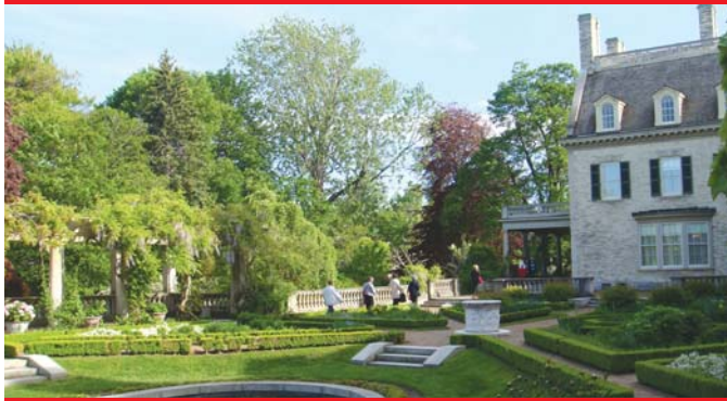
מוזיאון קודאק ברוצ'סטר