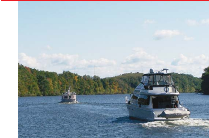
שיט בנהר אוסווגו