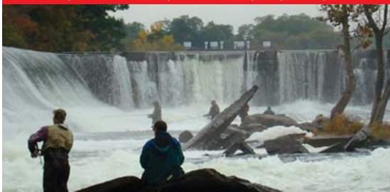
דייג באירי קאנל