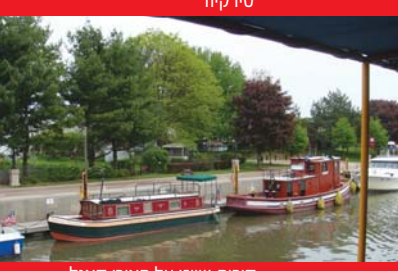
סירות שיט על האירי קאנל