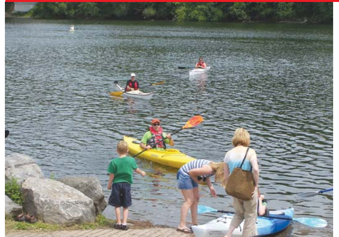
קיאקים בנהר אוסונוגו

וה-FINGER LAKES בין כומים ויקבים מרהיבים לצד אגמים ונהרות, מותיר תחושה של עוד גם אחרי 5 ימים של רוגע ושלווה.